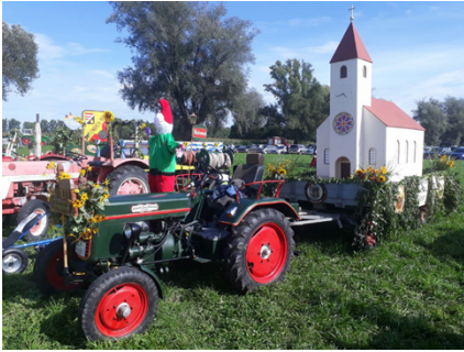
Festwagen Wangener "Käppele"

An dieser Stelle nochmals ein herzliches Dankeschön an alle Teilnehmer und die „Festwagen Helfer“, die in zahlreichen Arbeitsstunden das Käppele „sonntagsfein“ machten.