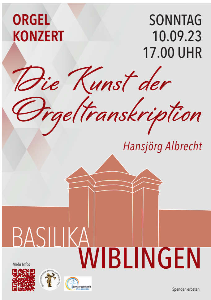
Foto: St. Martin, Wiblingen