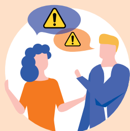
Familien- und Freundeskreis, Nachbarschaft