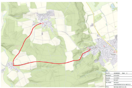
Umleitung überörtlich BA 2.1

Im Mitteilungsblatt Nr. 09/2024 haben wir bereits ausführlich über die Baumaßnahme informiert. Mit Baubeginn zum 09.04.2024 gelten nun für den ersten Bauabschnitt 2.1 folgende Verkehrsrechtliche Anordnungen.