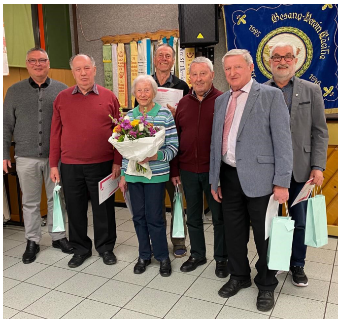
Das Foto zeigt Vorstand und Jubilare von li. nach re