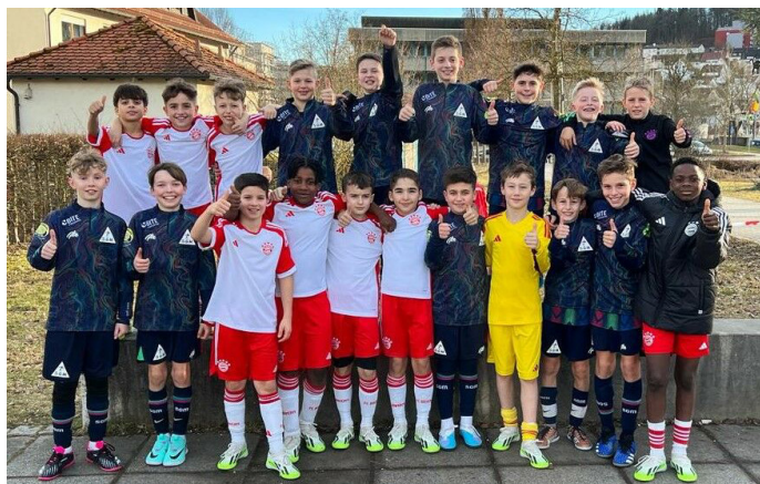
Gemeinsames Foto mit den Kids vom FC Bayern nach dem Spiel

Foulspiel vor dem Führungstreffer. Lange stand es 2:1 für die Bayern und Illerrieden hatte sogar die Großchance zum Ausgleich. In der Schlussphase hieß es dann alles oder nichts, Bayern nutze dann die sich bietenden Räume aus und gewann am Ende auch verdient mit 4:1. Bayern besiegte im anschließenden Viertelfinale auch den VfB Stuttgart, scheiterte aber im Halbfinale an Eintracht Frankfurt. In der Abschlusstabelle konnten die Sportfrunde trotz allem die Grashoppers Zürich hinter sich lassen und stolz auf das Erreichte sein. Tolle Leistung und die SGM super repräsentiert.