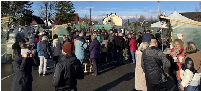
SFI Christbaumverkauf 2023

Bei strahlendem Sonnenschein fand der diesjährige Christbaumverkauf zahlreichen Anklang. Die Sportfreunde bedanken sich bei allen Gästen, welche durch Ihr kommen das Projekt unterstützt haben. Vielen Dank an der Stelle an alle helfenden Hände, welche durch Ihr Engagement zum Erfolg des Events beigetragen haben. Insgesamt wurden 750,- Euro anteilig an die drei sozialen Einrichtungen/Projekte gespendet.