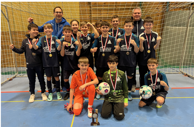
SGM D Junioren

Unsere D-Junioren haben den Läsko Cup in Vöhringen gewonnen. Die Vorrunde beendeten unsere Kids als Gruppensieger und schafften durch einen 2:1 Sieg im Halbfinale gegen den FV Belenberg den Finaleinzug. Hier zeigte unser Team eine starke Leistung und gewann verdient mit 1:0 gegen die SGM Roggenburg/Beuren. HerzlichenGlückwunsch!