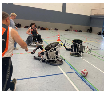
Einsatz bis zum Umfallen an unserem Heimspieltag...

Ohne unsere zahlreichen Helfer wäre dies undenkbar gewesen! Danke an alle Helferinnen und Helfer, ob im Hintergrund oder im Vordergrund, die dieses Saisonergebnis erst möglich gemacht haben. Danke an die Betreuer, die Mechaniker, die Helfer im Verkauf an den Heimspieltagen, dem Hauptverein und ganz besonders an unsere Hausmeister für die großartige Unterstützung. Wir sind uns bewusst, dass unsere Spieltage auch für die Hausmeister einen enormen Aufwand verursachen. Vielen Dank, dass Ihr uns dennoch so tatkräftig unterstützt!