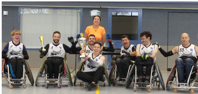
Meister 2. Bundesliga 2025

Ende März sowie den Spieltag am 11. und 12. Oktober in Leipzig zur Vize-Meisterschaft in der ersten Bundesliga. Lediglich den Agivia Sharks Berlin mussten wir uns geschlagen geben. In der zweiten Bundesliga konnten wir uns sogar den Meistertitel holen! An den Auswärts-Spieltagen am 17. und 18. Mai in Karlsruhe und am 19. und 20. Juli in München haben wir uns so erfolgreich durchgesetzt, dass die Meisterschaft mit einem weiteren Sieg an unserem Heimspieltag im November gesichert war. Wir blicken also auf eine äußerst erfolgreiche Saison 2025 zurück.