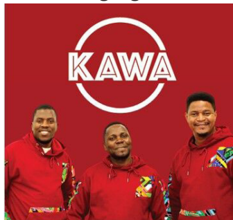
Ugandas Stimmen auf Deutschland-Tour zu Gunsten der Mmunye-Stiftung Uganda.